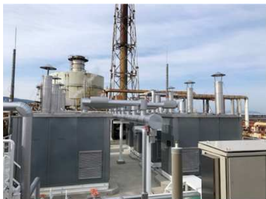
<貫流ボイラー設備>

2022年3月、高効率の小型貫流ボイラー8基を当社ボイラー区画に設置しました。これは当社を取り巻く事業形態の変化に対応するため、プロジェクトとして取り組んだものです。